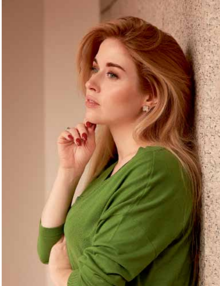
STYLING: JANO NIMÁK, MAKE-UP: MICHAELA OHEMOVÁ, VSL: VLASTY MICHAELA OHEMOVÁ / BALMAIN HAIR COUTURE, PRODUKCE: IVANA DRÁBKOVÁ